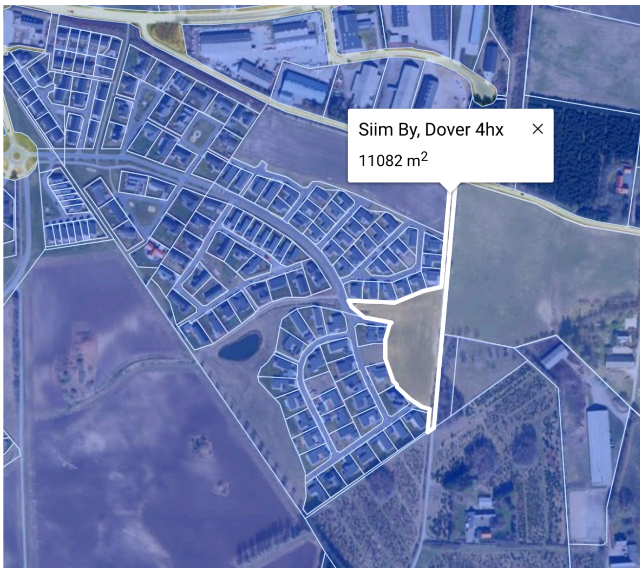
Figur 1: Matrikel til overtagelse (billede fra krak.dk)